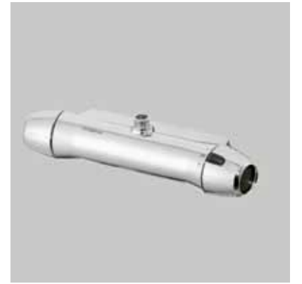
FM Mattsson 9000E termostaattihana Paineentasaajalla varustettu termostaattihana. Liitos ylös. FMM 8211-1500 LVI-nro 6358013