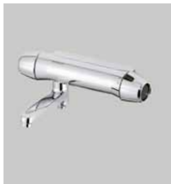
FM Mattsson 9000E termostaattihana Paineentasaajalla varustettu termostaattihana. Kääntyvä vaihdinjuoksuputki. FMM 8200-1500 LVI-nro 6358011