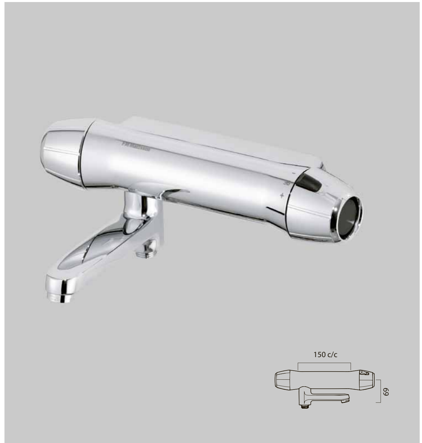
FM Mattsson 9000E termostaattihana Paineentasaajalla varustettu termostaattihana. Kääntyvä vaihdinjuoksuputki.

FMM 8200-1500 LVI-nro 6358011 Saatavana myös suihkuhanana (katso sivu 9)