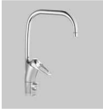
FM Mattsson 9000E I keittiöhana Pesukoneventtiilein. Kääntyvä juoksuputki, 4 juoksuputken rajoitinvaihtoehtoa. FMM 8011-8000 LVI-nro 6258279 Ilman pesukoneventtiiliä FMM 8010-8000 LVI-nro 6258278