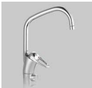
FM Mattsson 9000E III -keittiöhana Pesukoneventtiilein. Kääntyvä juoksuputki, 4 juoksuputken rajoitinvaihtoehtoa. FMM 8021-8000 LVI-nro 6258281 Ilman pesukoneventtiiliä FMM 8020-8000 LVI-nro 6258280