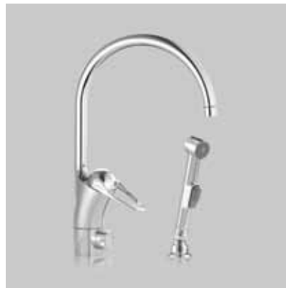
FM Mattsson 9000E II -keittiöhana Pesukoneventtiilein. Itsestään sulkeutuva käsisuihku ja läpivientikappale. Kääntyvä juoksuputki, 4 juoksuputken rajoitinvaihtoehtoa. FMM 8006-8000 LVI-nro 6258277 Ilman pesukoneventtiiliä FMM 8005-8000 LVI-nro 6258276