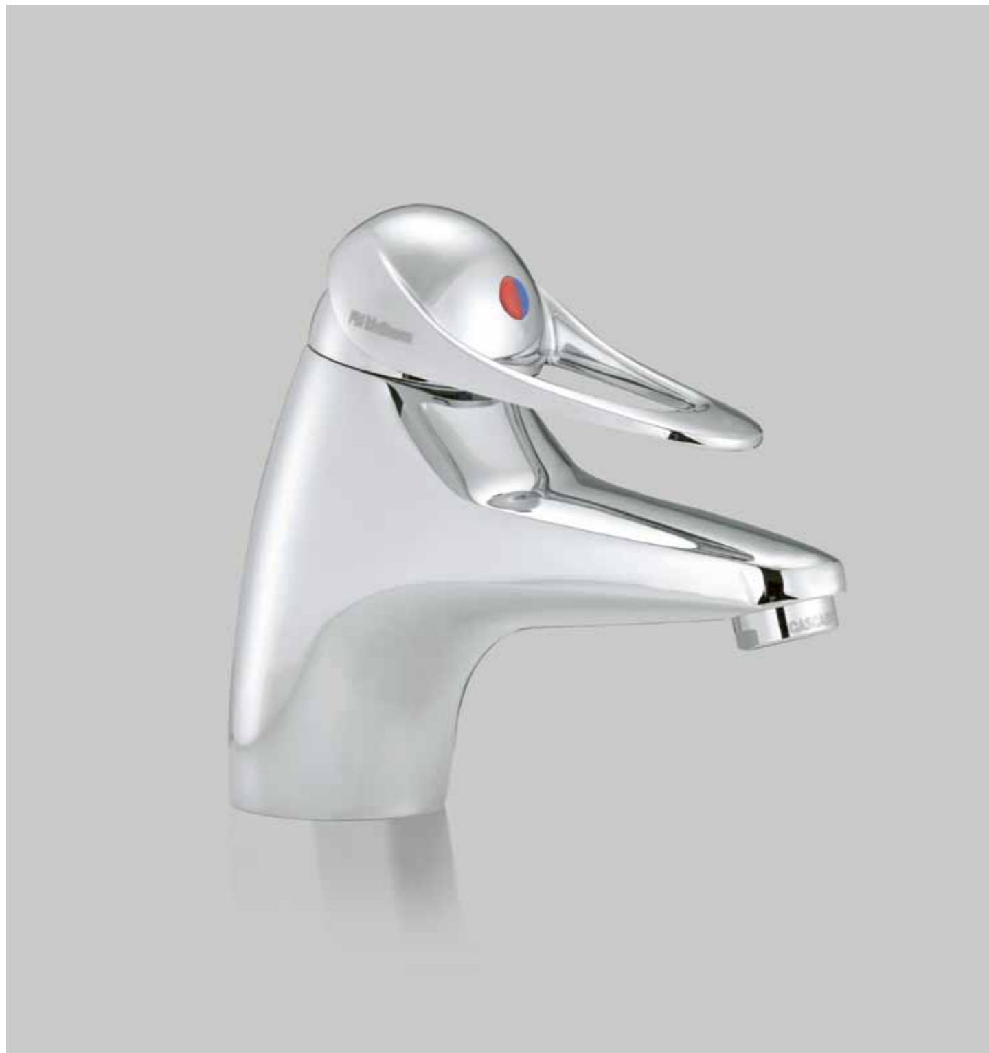
FM Mattsson 9000E pesuallashana