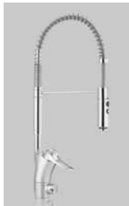
FM Mattsson 9000E Flexi -keittiöhana Yhdistetty juoksuputki ja huuhtelusuihku, kääntösäde lukittavissa. Pesukoneventtiilein. FMM 8101-8000 LVI-nro 6258283 Ilman pesukoneventtiiliä FMM 8100-8000 LVI-nro 6258282