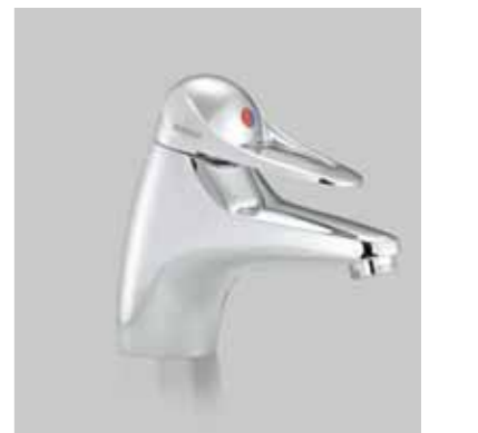
FM Mattsson 9000E pesuallashana FMM 8050-8000 LVI-nro 6158015