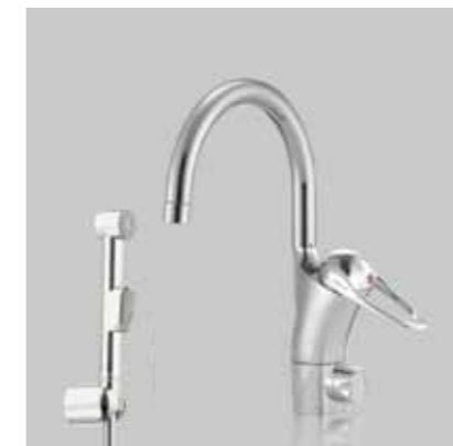
FM Mattsson 9000E pesuallashana (Tuote saatavana 1.4.2010 alkaen). Pesukoneventtiilein. Kääntyvä juoksuputki. Itsesulkeutuva käsisuihku. FMM 8058-8000 LVI-nro 6158018