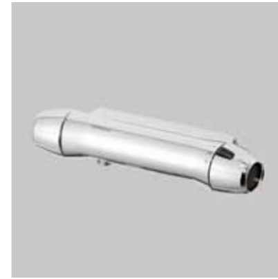
FM Mattsson 9000E termostaattihana Paineentasaajalla varustettu termostaattihana. Liitos alas. FMM 8210-1500 LVI-nro 6358012