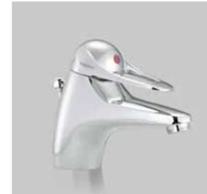
FM Mattsson 9000 E pesuallashana Vipupohjajaventtiili. FMM 8055-8000 LVI-nro 6158016