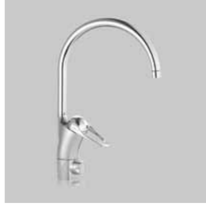
FM Mattsson 9000E II -keittiöhana Pesukoneventtiilein. Kääntyvä juoksuputki, 4 juoksuputken rajoitinvaihtoehtoa. FMM 8001-8000 LVI-nro 6258275 Ilman pesukoneventtiiliä FMM 8000-8000 LVI-nro 6258274