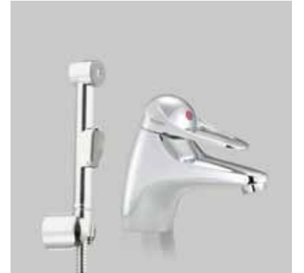
FM Mattsson 9000E pesuallashana Itsesulkeutuva käsisuihku. FMM 8057-8000 LVI-nro 6158017